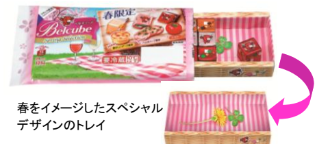
春をイメージしたスペシャルデザインのトレイ

パッケージには春らしい桜や草原のピクニックシーンが描かれています。トレイ(中箱)も春をイメージしたスペシャルデザインです。袋を開けると籐のバスケットをデザインしたトレイにキラキラと3種のフレーバーがアソートされ、食べ進めていくとトレイの底からタンポポと四つ葉のクローバーが顔をのぞかせるという工夫もされています。